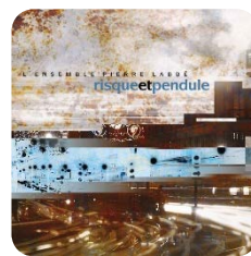
Risque et pendule , 2003 L'ensemble Pierre Labbé Jazz, Ambiances Magnétiques