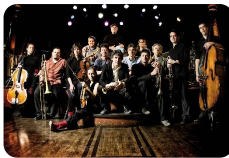
Tremblement de fer, Jazz

http://www.youtube.com/watch?v=eNL-oEkhxFS