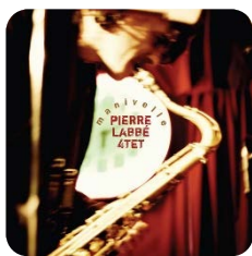
Manivelle , 2009 Finaliste, prix OPUS 2010 Pierre Labbé 4TET Jazz, Ambiances Magnétiques