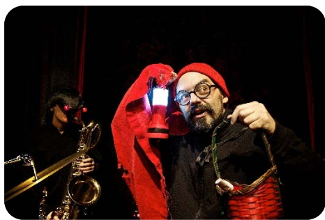
Les Fables de la patère, Jeunesse

http://www.youtube.com/watch?v=eNL-oEkhxFS